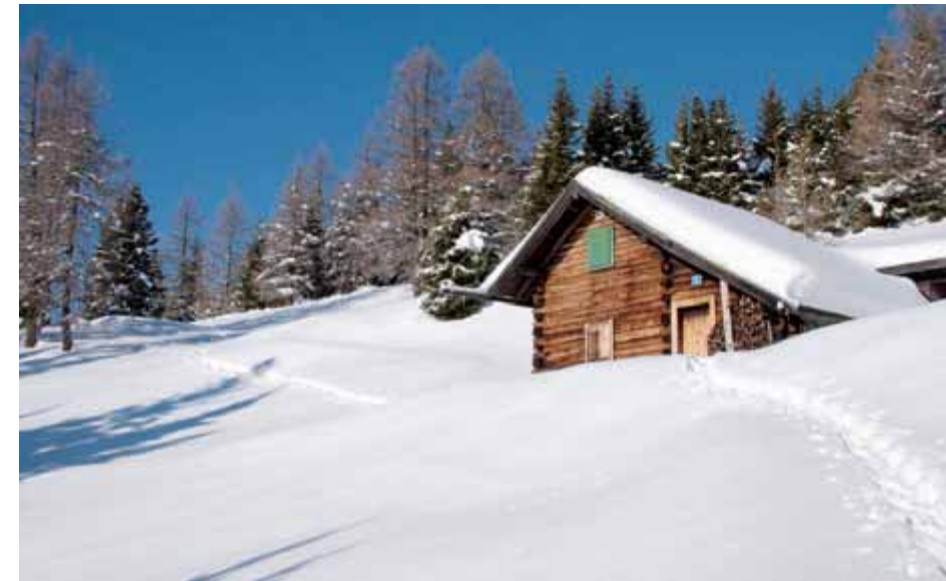
Winterwanderungen in der verschneiten Natur des Wipptales sind ein besonderes Erlebnis

Jeden Mittwoch bietet der Tourismusverband Wipptal, Ortsstelle Steinach, kostenlose geführte Wanderungen durch das idyllische, tiefverschneite Wipptal und seine Seitentäler an. Erfahrene Wanderführer begleiten die Teil-