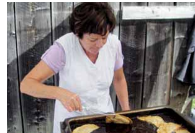
An den Ständen der Via Culinaria gab's Tiroler Schmankerl zum Verkosten

Diese kulinarische Veranstaltung in Trins am Spazierweg zwischen dem Liftstüberl und der Pumafalle wurde aufgrund des Schlechtwetters auf 9. September 2012 verschoben, begeisterte dann aber zahlreiche Besucher bei herrlichem Herbstwetter. An einigen Ständen wurden, wie schon in den letzten Jahren, regionale Schmankerln, wie Krapfen süß und deftig, Gulasch vom Schmirner Almochs, Würste, Bauernbrot, Tiroler Gröstl, Kiachl mit Kraut, Moosbeernocken, Gerichte rund um die heimischen Pilze, Kuchen & Kaffee, Schnäpse, Liköre, Weine und vieles mehr angeboten – natürlich alles aus heimischer Produktion!