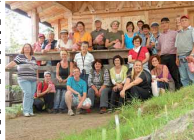
Ganz besondere Menschen zu Gast einer ganz besonderen Region

Eine Ferienwoche der besonderen Art verbrachten gehörlose und hörbeeinträchtigte Menschen Ende Juli 2012 in Trins im Gschnitztal. Heuer fand diese Veranstaltung bereits zum zweiten Mal statt und erfreulicherweise konnte die Ortsstelle Trins des TVB Wipptal eine Steigerung gegenüber dem letzten Jahr verbuchen. Das Programm dieser