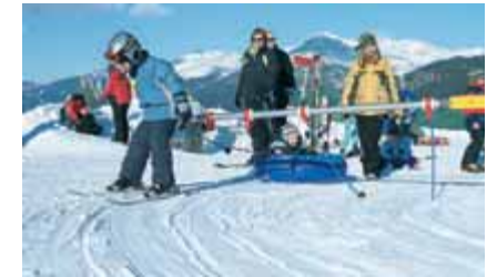
Mit dem Skibus gemütlich zum Pisteneinstieg

Während der Wintersaison wird ein offizieller Skibus für die Skigebiete des Wipptales eingesetzt. Dieser Bus verkehrt planmäßig zwischen Steinach, Trins, Gschnitz, Matri, St. Jodok, Schmirn, Gries und Obernberg. Mit gültiger abgestempelter Gästekarte können alle Gäste diesen Skibus kostenlos benutzen.