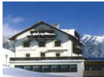
Das Schitourenhotel im Wipptal

Familie Almberger Aussertal 30 A-6157 Obernberg am Brenner Tel. +43/5274/87511 Fax DW 66 Mobil: +43/664/4340471 info@almis-berghotel.at www.almis-berghotel.at