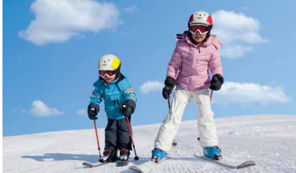
Pistenspaß am Tag und in der Nacht, für Groß und Klein: Trins bringt's