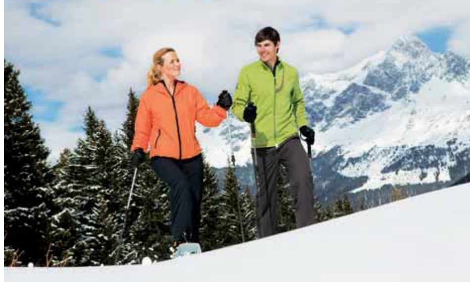
Das Wipptal ist eine weiße „Spielwiese“ für alle, die im Urlaub gerne „auf großem Fuß“ leben...

Fackelwanderungen haben immer etwas urig Romantisches an sich. Die brennenden Fackeln sorgen für eine ganz besondere Atmosphäre und verbreiten eine angenehme Wärme. Bei der Fackelwanderung zur Bergeralm geht es eine knappe Stunde durch den verschneiten Winterwald zur Bergeralm. Nach einer Rast in der Bergeralm wandern die TeilnehmerInnen im Schein der Fackeln retour. Ein unvergesslicher Abend für die ganze Familie unter den Sternen Tirols mit Wanderführerin Brigitte. Treffpunkt: Mittwochs, 20 Uhr, Humlerhof Nösloch (Parkplatz). Dauer: ca. 3 Std. Termine: 26.12.2012, 04.01. (Freitag!), 06./13./20.02.2013. Mitzubringen ist warme Kleidung, gutes Schuhwerk und vor allem gute Laune. Die Teilnahme ist kostenlos und die Fackeln werden gestellt. Auf Ihr Kommen freut sich der TVB Wipptal, Ortsst. Gries. In Obernberg freuen sich Kinder und Erwachsene, wenn sie durch die verschneite Landschaft, vorbei an Häusern, Bächen und Mühlen, mit einer brennenden Fackel spazieren gehen. Diese Veranstaltung wird per Plakatanschlag angekündigt. Beginn ist jeweils um 19.30 Uhr, Dauer ca. 1 ½ Stunden. Danach, wer will, Einkehr in einen Gasthof. Wanderführerin Melanie freut sich auf zahlreiche Aktive. Teilnahme kostenlos. Keine Anmeldung erforderlich. Termine laut Anschlag. Bereits fixierter Termin: 03.01.2013.