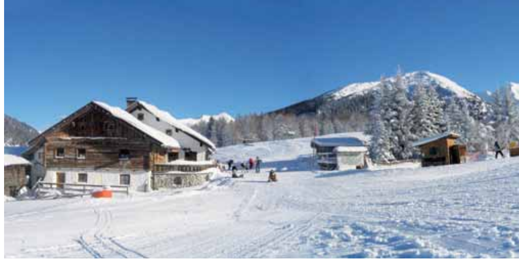
Halbzeit am Weg zum Gipfel: Die Sattelalm

Am Donnerstag, 07. Februar 2013, um 20 Uhr referieren Experten zum Thema „Skitouren – grenzenlose Freiheit?“ und geben Einblicke in ein naturschonendes Miteinander von Wintersportlern und Wildtieren. Wo? Steinacher Hof.