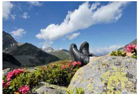
Der Finstertaler Stausee ist ein markantes Zeugnis von alpiner Baukunst und ein Ziel für die ganze Familie. I'm a wanderer. Und jetzt raste ich inmitten der Bergwelt der Stubai- und Ötztaler Alpen.

Touren leichter in Angriff, wie z. B. die Sellrainer Hüttenrunde, die in mehreren Varianten zu verschiedenen bewirtschafteten Hütten und Almen führt.