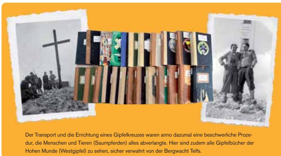
Der Transport und die Errichtung eines Gipfelkreuzes waren anno dazumal eine beschwerliche Prozedur, die Menschen und Tieren (Saumpferden) alles abverlangte. Hier sind zudem alle Gipfelbücher der Hohen Munde (Westgipfel) zu sehen, sicher verwahrt von der Bergwacht Telfs.