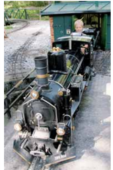
Gartenbahn Minidampf Tirol in Barwies