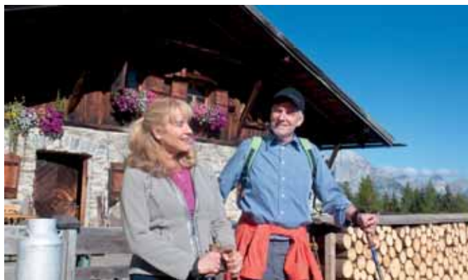
Am Gipfel des 3.016 m hohen Sulzkogel schweifen die Blicke in die Ferne. Wortlos, denn was soll man angesichts solch wilder landschaftlicher Schönheit noch sagen? Die Oberhofer Melkalm (r.u.) ist Ausgangspunkt für den Höhenweg.

mit Klassikern der österreichischen Küche verwöhnt, die man am besten auf der Sonnenterrasse mit Blick auf das unvergessliche Alpenpanorama genießt.