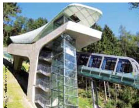
Bahn zum Alpenzoo Innsbruck