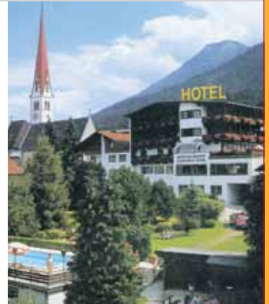
Genießen in gemütlichem Ambiente...

Helga & alle fleißigen Hände vom Grischeler Reservierungen unter 05262-625 39