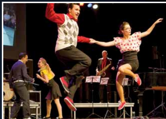
Boogie Woogie Festival im Rathausaal Telfs