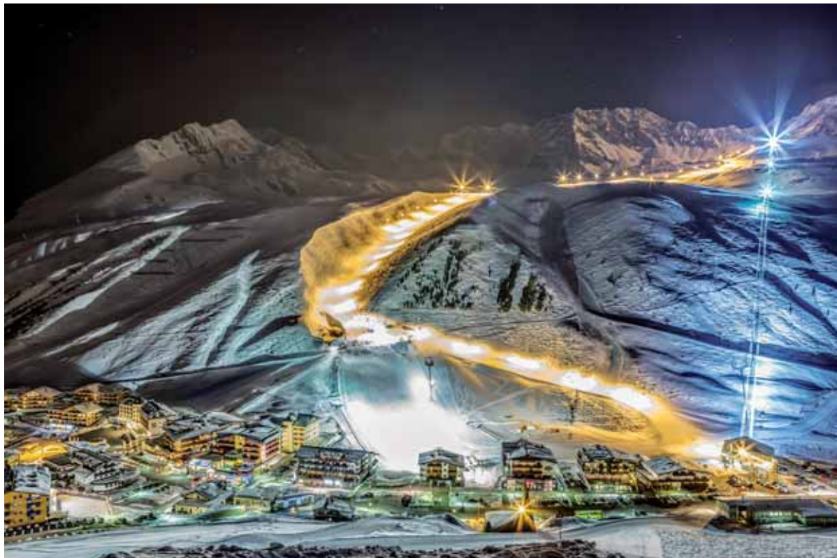
Das Kühtai ist Österreichs höchstgelegener Skort, begeistert aber auch mit einem Bergsommer zum Entdecken, Staunen und Genießen.

Ab einer Höhe von 2.000 Metern über dem Meer kommen beim Wandern besonders effiziente Trainingseffekte zur Wirkung. Deshalb empfiehlt sich ein Abstecher nach Kühtai. sonnenzeit hat die Herausforderung angenommen und ist auf Schusters Rappen auf dem neuen Oberhofer Höhenweg gewandert, der das Inntal mit dem benachbarten Kühtai verbindet.