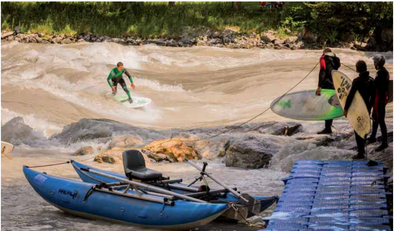
Auch Passivsurfen, also Zuschauen, macht Spaß: Man muss schon was draufhaben, um am wilden Inn zu bestehen...

im Mai und Juni das viele Schmelzwasser von den Bergen kommt. Auch gibt es kaum Baubüros, die sich mit den Berechnungen von optimalen Flusswellen beschäftigen. Zu viele Unbekannte gibt es dabei in der mathematischen Gleichung. Dennoch ist man in der AREA 47 auch für die kommende Saison zuversichtlich. Dann kann die Erfolgswelle weiter rollen, denn Riversurfing – das Surfen auf stehenden Wellen in Flüssen – wird zusehends beliebter und entwickelt sich ständig weiter. Sogar die Beachgirls und Beachboys, die ein Meer vor der Haustür haben, steigen gern von Zeit zu Zeit auf fließendes Gewässer um. Und die surfbegeisterten Töchter und Söhne der Alpen sind sowieso vom Fluss-Surfen angetan, was nicht nur damit zu tun hat, dass die Anlagen leicht und schnell erreichbar sind.