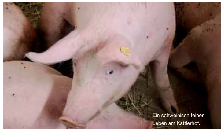
Ein schweinisch feines Leben am Kattlerhof.