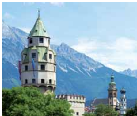
Erlebnis Münze Hall