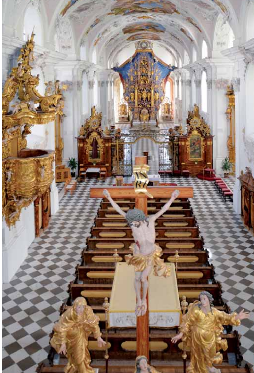
Die prachtvolle barocke Ausstattung der Basilika zieht Besucher aus aller Welt in ihren Bann.