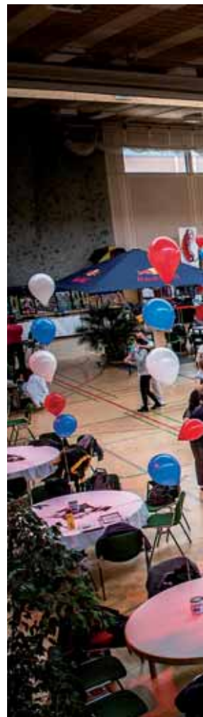
Latinoeeling auf dem Tanzparkett: Beim Salsacongress Austria im Sportzentrum Telfs geht's rhythmisch und heiß her!

Wenn internationale Top-TänzerInnen zu lateinamerikanischen Rhythmen übers Parkett fegen, ist wieder Salsacongress-Zeit. Seit über 10 Jahren findet der größte Latin Event Österreichs in Tirol statt und für die 12. Ausgabe dieses bereits legendären Tanzwochenendes wurde wieder das Telfer Sport- und Veranstaltungszentrum als optimale Location erkoren. Auf über 2.000 m 2 Fläche werden hier aktive und kontemplative Salsafans zusammentreffen, um mitten im Tiroler Winter bei heiß(blütig)er Stimmung viele Tanz-Workshops, Partys und ein beeindruckendes Showprogramm zu zelebrieren.