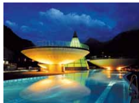
Aqua Dome Längenfeld