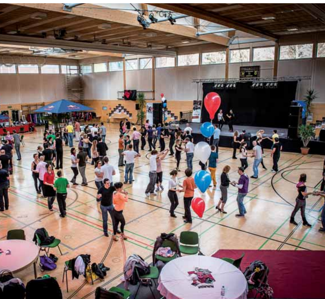
Telfs tanzt: Das Sport- und Veranstaltungszentrum ist die ideale Location für Tanzevents internationalen Zuschnitts.

beim Highlight am Samstagabend nicht zu kurz kommt. Denn beim großen „Ball de Salsa“ gerät das Sport- und Veranstaltungszentrum garantiert ins Brodeln mit Schnupperworkshops, Social Dancing mit DJs und Showtänzen internationaler Teams bis in die frühen Morgenstunden! Bis zur Abschiedsfeier „Fiesta dominicanísima“ am Sonntag Abend hält die Kondition aber noch auf jeden Fall, was Profis und Publikum beim gemeinsamen Abtanzen gerne beweisen. Professionelle Organisation, bewährte Instrukturen, Latin Sound vom Feinsten und lauter positive Vibes – wer den Salsacongress Austria einmal besucht hat, nickt jetzt nur. „Sí, sí, sí!“